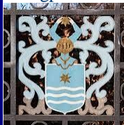
Niels Juels våbenskjold

Tangproblemer berørte vi også, men det kræver meget mere plads.