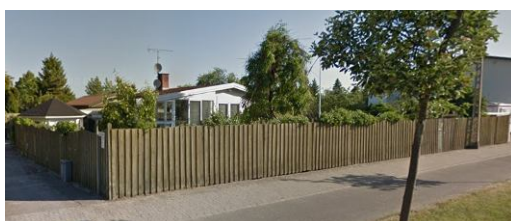
Hjørnet Sommerstien /Greve Strandvej 22.

Måske er der friske vindruer på vej tilbage – afhængig af... ?