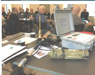
Billedet viser sonar til montering på bøger og scanner som kan aflæse sonarmålinger.