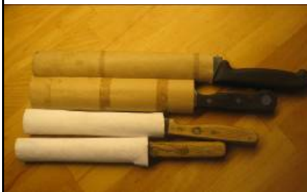
Knivene stikkes i paprør fra køkkenruller

I vort nyhedsbrev nr 24 – husker du det kære medlem! – havde vor køkkenskriver en ide om hvordan man opbevarer løse knive i skuffen.