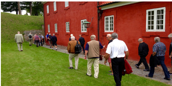
En udflugt til et sted af fælles interesse