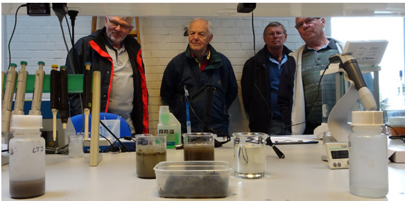
Vandprøver på Mosede rensningeanlæg