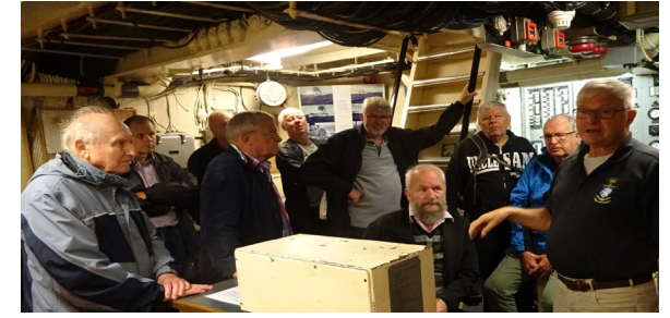
En beretning om fregatten Peder Skram