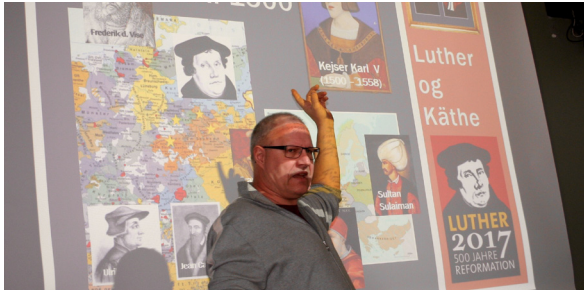
Et foredrag om Luther