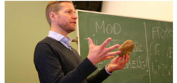
Et foredrag om mod til at være menneskelig