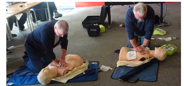
En instruktion i at give hjertemassage