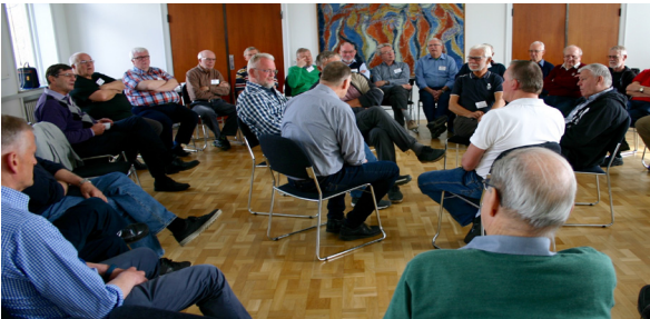
Et aktuelt emne, som vi drøfter