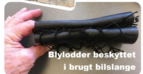
Blylodder beskyttet i brugt bilslange