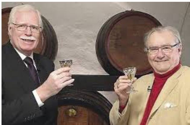
I Rosenborgs vinkælder for at smage på 400 år gammel vin sammen med Prins Henrik

Vejen til det gode liv – for voksne mænd