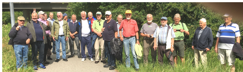
Stop v. S-banen og åen, v den tidligere kommunegrænse mellem Greve og Kildebrønne