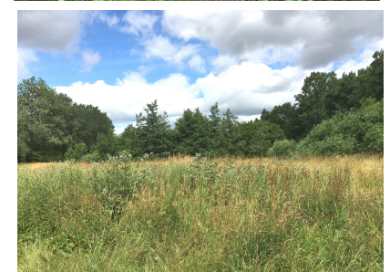
"Urskoven" og engen