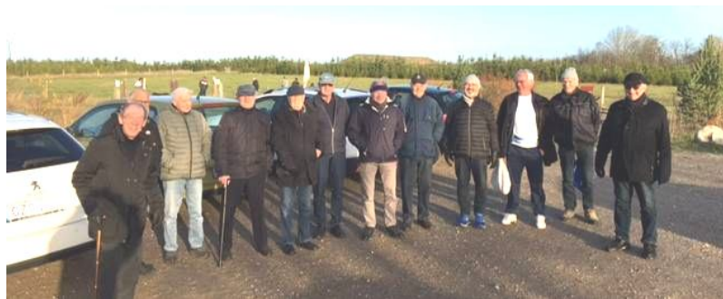
Her ses hold A og Hold B