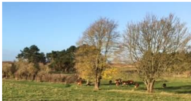
Det er køerne til højre bag træerne