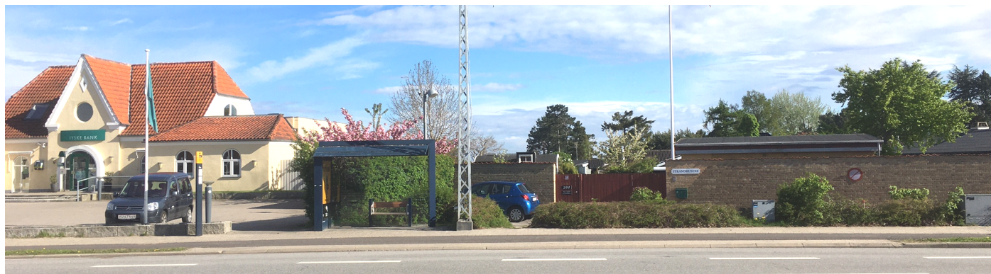
Billede af ”Den røde Port” v. Strandhusene – Hundige Strandvej 201.

I kan således møde kl. 9:30 for en gåtur på stranden. Eller møde v. Olsbækken kl. 11:15, og vi går samlet til Strandhusene. Flere detaljer – se efterfølgende!