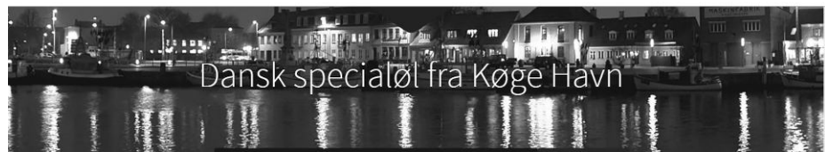
Dansk specialøl fra Køge Havn

BRYGGERIET BRAUNSTEIN: Vi tager alle med toget linje E fra Greve kl. 9:26. (Toget er i Køge kl. 9:43). Pris 175.- at betale senest den 7. feb. på vor konto eller MobilePay. Efter rundvisningen er der smagsprøver på det gode øl. Vi kan ikke indtage fast føde på Bryggeriet, men hvis nogen ønsker at spise et par håndmadder efterfølgende, er der flere steder i Køge, hvor det kan lade sig gøre. Dette aftales efter rundvisningen.