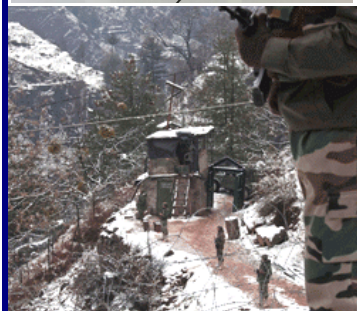
Kashmir, bjergigt område Arkiv foto