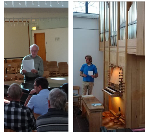
Elaf synger for

Hver pibe skal have luft og regulator – så det er lidt af et job at vedligeholde.