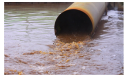
Sådan så det ofte ud i 1970

Endelig er der landbruget, hvis udledninger og brug af pesticider er en kilde til evig debat.