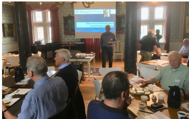
Den gamle byrådsal har plads til ca. 60 medlemmer