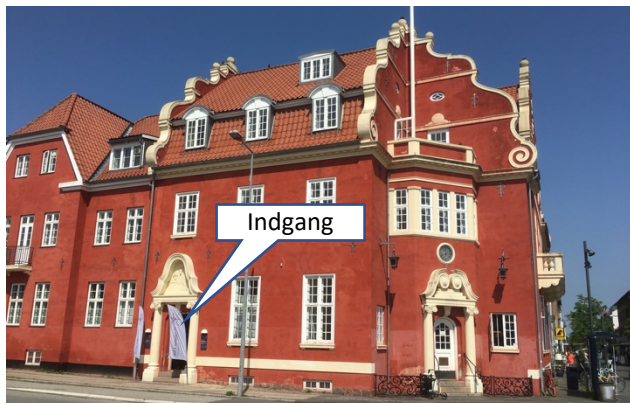
Hørsholm gamle rådhus, Rungstedvej 1B