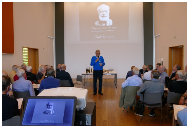
Der er som hovedregel 70-100 deltagere ved møderne