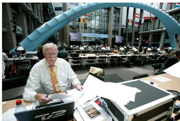
På arbejde for TV2 under et EU-topmøde i 2007

Og hvorfor fik TV2 verdensnyheden med udvidelsen af EU i 2002 ?