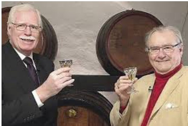
I Rosenborgs vinkælder for at smage 400 år gammel vil sammen med Prins Henrik

Vejen til det gode liv – for voksne mænd