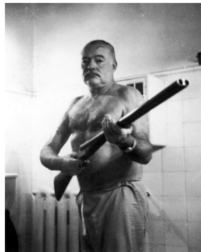
.... eller denne?

Tilslutningen til Hemingway klubberne og deres hurtige udbredelse bekræfter, at der er behov for et forum, hvor ældre mænd, som helt eller delvis har forladt arbejdsmarkedet, kan opretholde sociale relationer og kompetencer og etablere nye relationer.