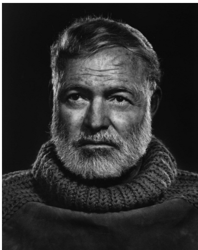
Denne Hemingway? .....