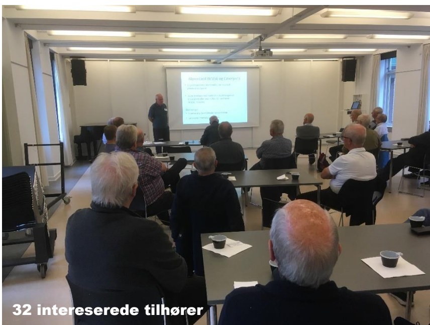
32 interesserede tilhører