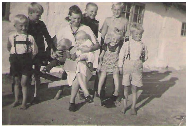
Mor sørgede for alt det derhjemme.

I mellemtiden havde jeg, som nu var blevet 23 år, fået arbejde som postbud i Greve.