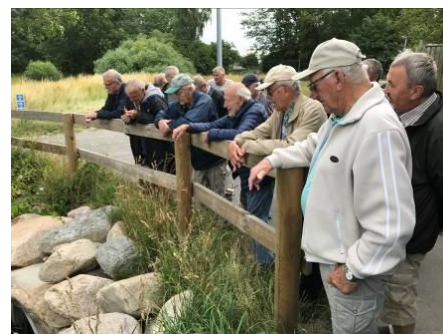
Ophold v. Olsbækken på vej til Jerismosevej