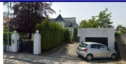
Yukon - Jerismosevej 5