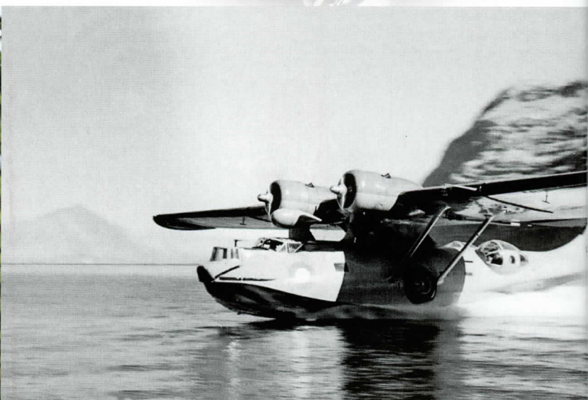
Catalina starter fra fjord i Grønland.