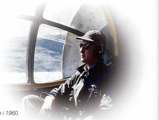
Forfatteren i 1960.

Vejledende priser: Trykt bog: 269,95 kr. E-bog: 169,99 kr. ISBN: 978-87-7218-809-6