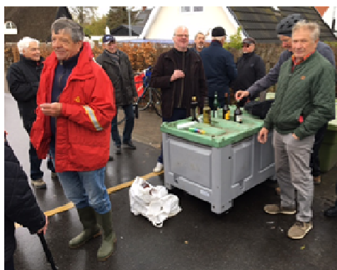
Ja – det var vådt – egen Club bar?