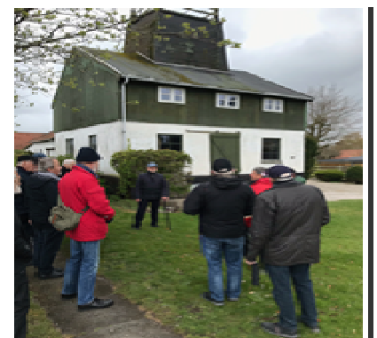
Karlslunde gamle mølle