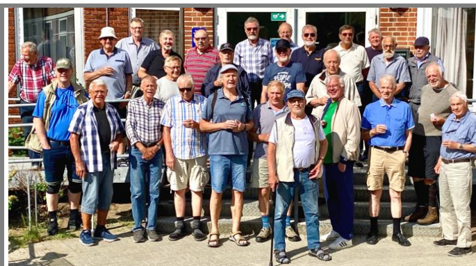
Alle mand på trappen inden turen.