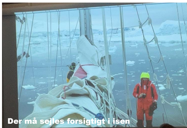
Der må sejles forsigtigt i isen