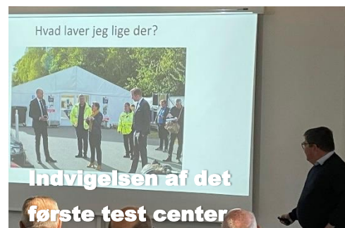
Indvigelsen af det første test center