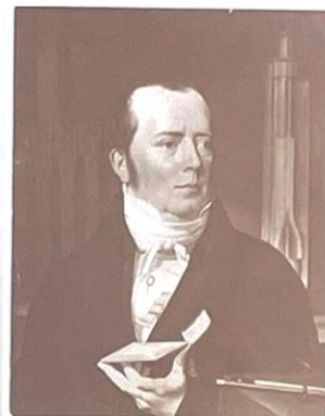
H.C. Ørsted som 45-årig. Fotografi efter maleri udført af Christoffer Wilhelm Eckersberg (1783-1853), 1822.