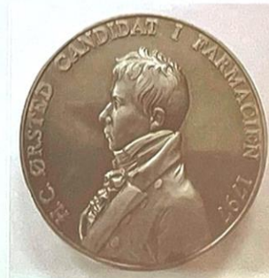
H.C. Ørsted medalje