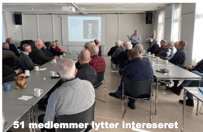
51 medlemmer lytter interesseret