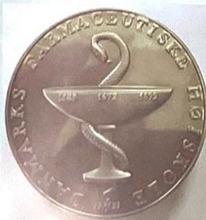
Danmarks Farmaceutiske Højskoles H.C. Ørsted-medalje præget i aluminium i 1977 i anledning af 200-året for Ørsteds fødsel.