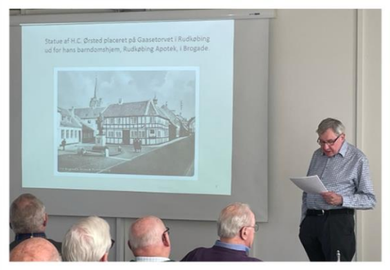
Statue af H.C. Ørsted placeret på Gassetorvet i Rudkøbing ud for barndomshjem, Rudkøbing Apotek, i Brogade