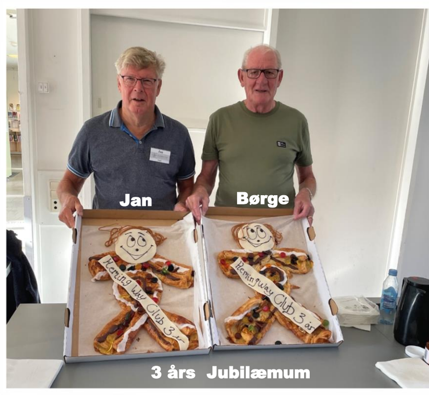
3 års Jubilæum