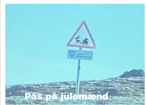
Pas på julemænd