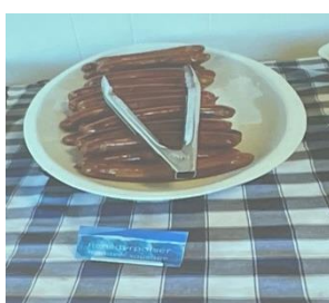
Rensdyr pølse i Roklubbens restaurant