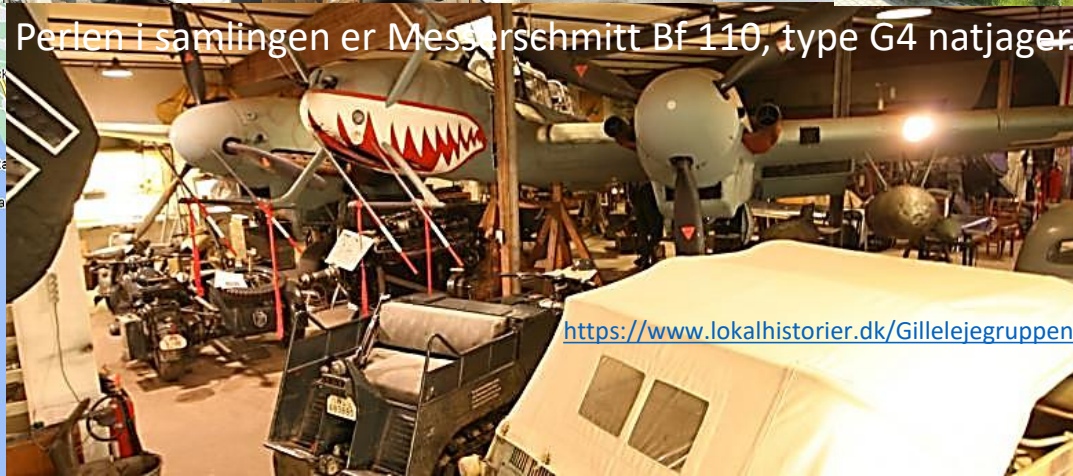
Perlen i samlingen er Messerschmitt Bf 110, type G4 natjager.