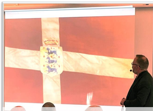
Christian X fik overleveret dette sønderjyske flag ved genforeningen 1920