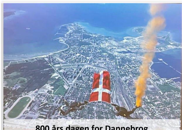
800 års dagen for Dannebrog 15 juni 2019 - Tallinn