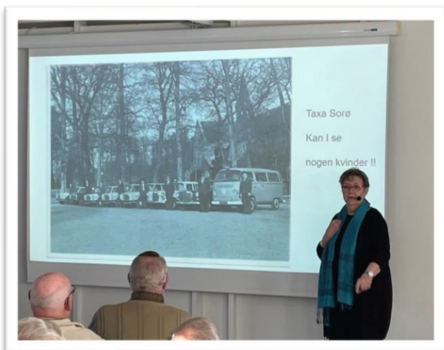
Gurli som taxachauffør, med kun mandlige kollegaer