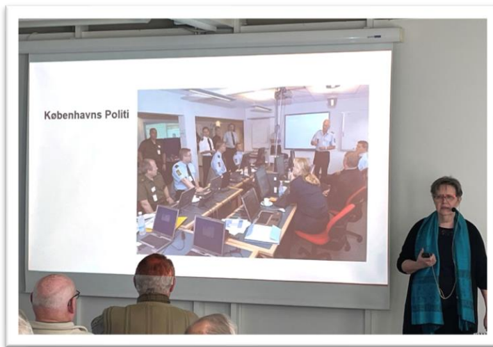
Gurli (HT) hos politiet ved omlægning af busruter ved kritiske situationer i København